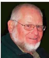
Jühü - im April 2023