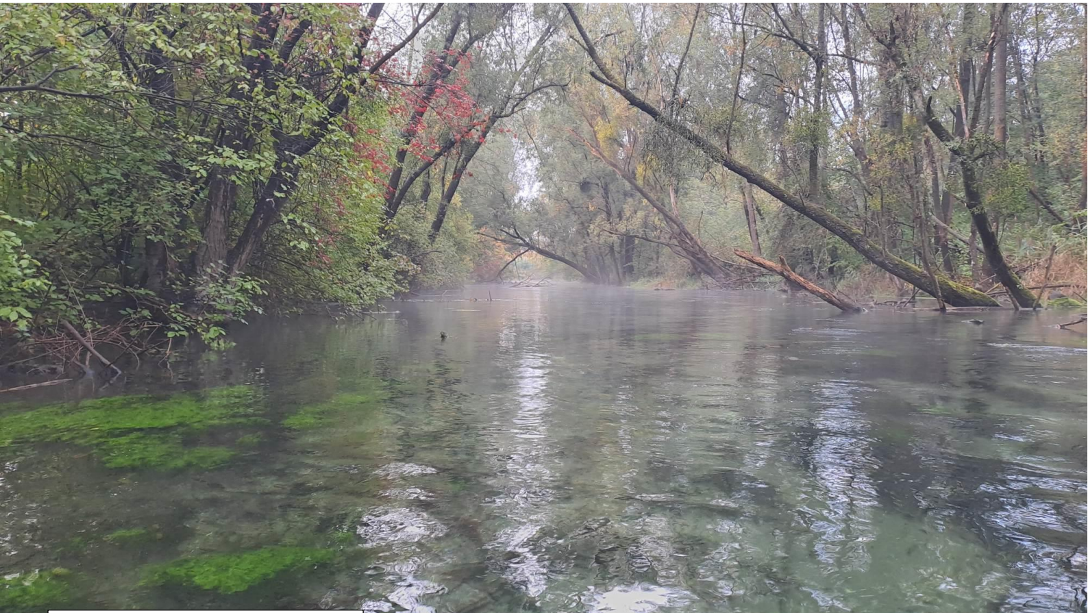
Armin Steimle: Groschenwasser